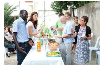
3 Repas avec les volontaires français