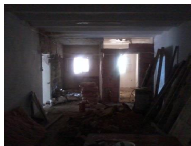
Figure 1 La cuisine en fin septembre

Voici ci-après un panorama des photos avant les finitions 1 :